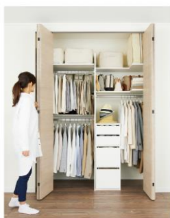
クローゼットタイプ