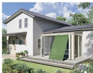
フォレストグリーン