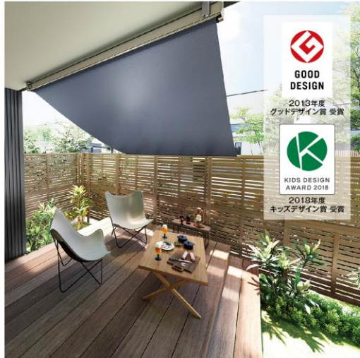
インディゴデニム