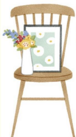
お気に入りの絵や切り花を飾るなど、季節にあわせたコーディネートを楽しむスペースを。

デザインが美しい椅子をベースに、スペースを作るのもおすすめです。観葉植物や花器、アートフレームなどを飾ったり、郵便物や雑誌置き場として利用したり。低めのスツールは、ソファ横でコーヒーターブルとして活用しても。部屋の雰囲気作りや整とんにひと役買ってくれます。