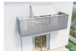
Balcony style 手すり固定タイプ