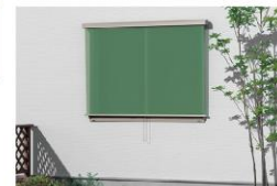
Basic style フック固定タイプ

※1, 3 一般複層ガラスの窓にスタイルシェードを使用した場合の性能です。開運JISなどに基づき計測および算出した値であり、保証値ではありません。 ※2 社内シミュレーション値です。詳細なシミュレーション条件はカタログをご覧ください。