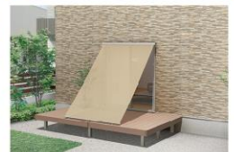
Deck style デッキ固定タイプ