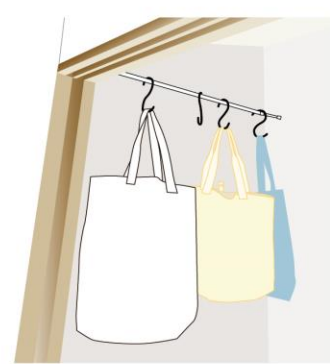
バッグも掛けて、見やすく収納できます

リ、帽子などを引っかけて収納すれば、一目瞭然です。 ● つっぱり棒で空間を仕切る …つっぱり棒2本をワイヤネットの両サイドに結束バンドで固定し、縦にして設置すれば、立派な間仕切りになります。押し入れはモノを分類しながら収納でき、天井と床で設置すれば、パーティションとして使えます。 いろいろな使い方ができるつっぱり棒ってやっぱりすごい！ぜひ、活用してみてください。